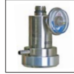
Regulador de flujo de demanda