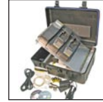
Equipo de sistema portátil MicroDock II