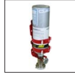
Montaje de pared de gas de calibración