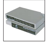
USB en cualquier lado

Para obtener la lista completa de accesorios, póngase en contacto con BW Technologies.